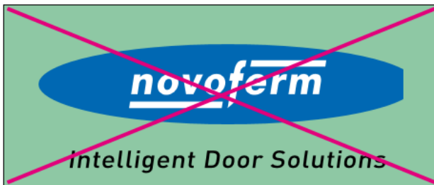
Positionierung auf farbigen Hintergründen