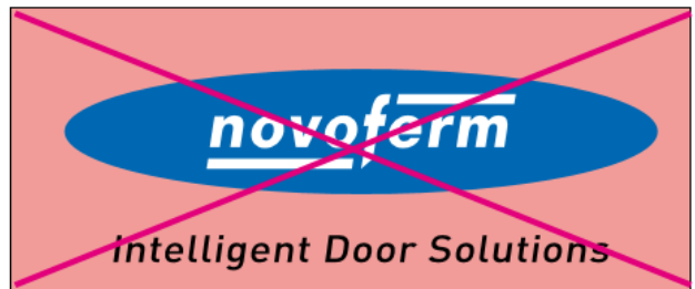
Positionierung auf farbigen Hintergründen