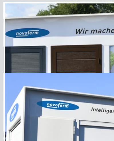
Logos und Claims für eine aussagekräftige Werbung

Bitte beachten Sie, dass die Lieferzeit für den Musterkubus und die gewünschte Exponatenausstattung bei 6–8 Wochen liegt.