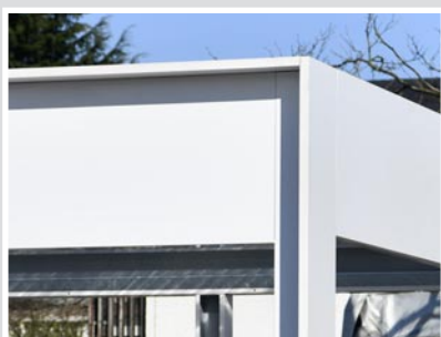
VEKAPLAN – für eine hochwertige Verkleidung

*Markierte Produkte, Ausstattungsdetails und Größen sind zwingend einzuhalten, um die reibungslose Montage und Nutzung sicherzustellen.