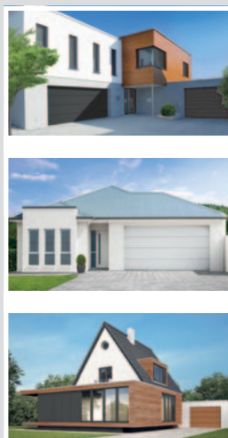
Werbefel mit Milieubildern